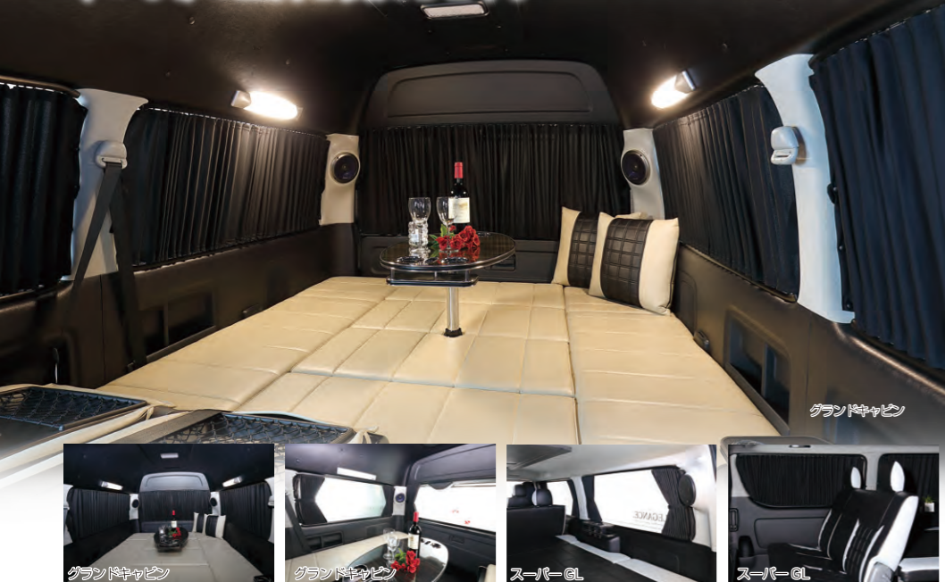
グランドキャビン