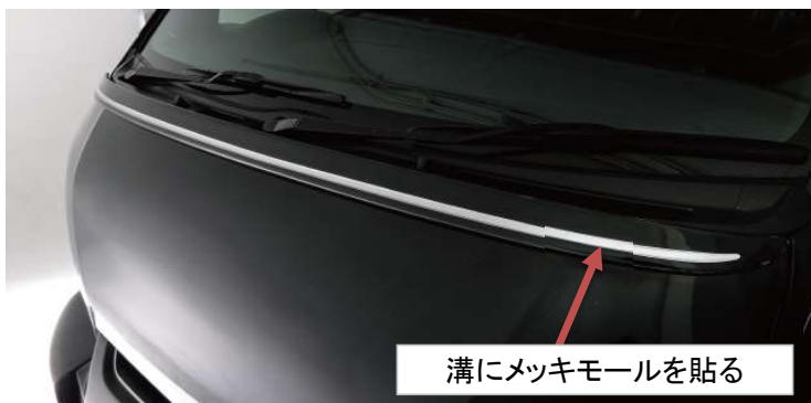
溝にメッキモールを貼る

株式会社ジェイクラブ 〒590-0155 大阪府堺市南区野々井269番地1 TEL 072-295-5288 FAX 072-295-5388 e-Mail info@j-club.info